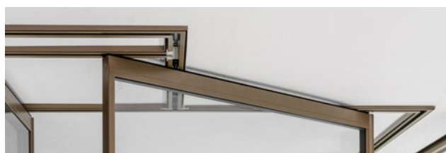
Bahnhof integriert in Decke