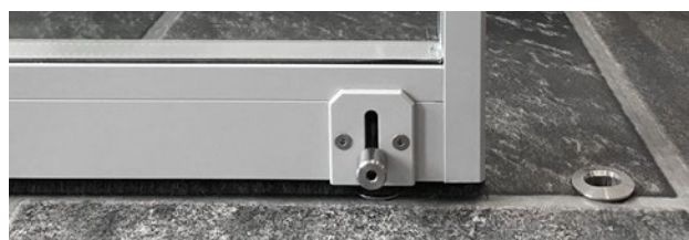
Steckriegel mit Bodenhülse