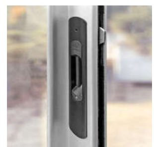
Muschelgriff mit Einhakverschluss