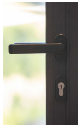
Schloss mit Türdrücker